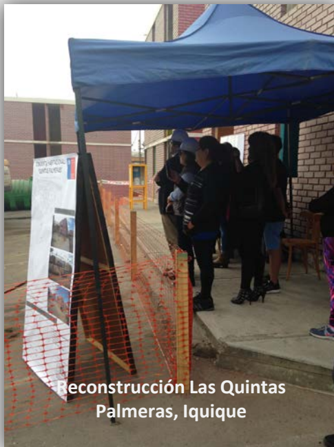
Reconstrucción Las Quintas Palmeras, Iquique