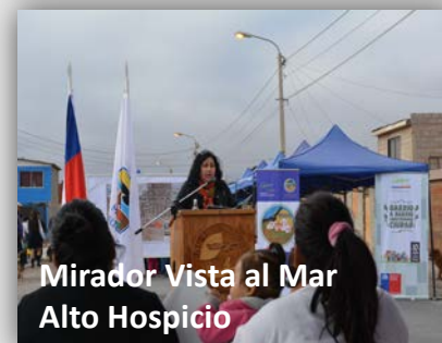
Mirador Vista al Mar Alto Hospicio