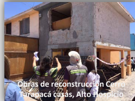
Obras de reconstrucción Cerro Tarapacá casas, Alto Hospicio