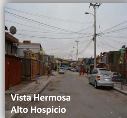
Vista Hermosa Alto Hospicio