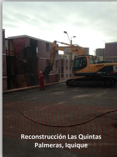
Reconstrucción Las Quintas Palmeras, Iquique