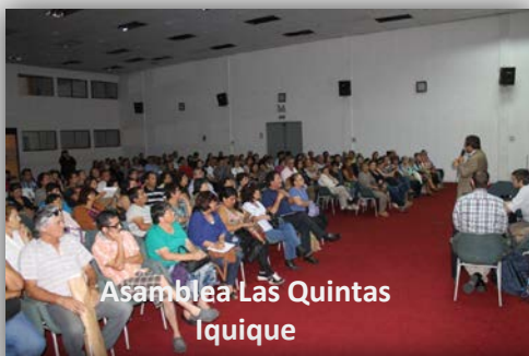
Asamblea Las Quintas Iquique

Además se desarrolla el Plan Maestro de Regeneración del entorno urbano de Las Quintas, que permitirá generar soluciones al territorio y un ordenamiento del sector, influenciado principalmente por el mercado que posee una escala de ciudad y que abastece a Alto Hospicio e Iquique, generando economías de escala a través de la diversidad de sus servicios. A la fecha, el proceso está adjudicado a la escuela de Arquitectura de la Universidad Católica de Chile y se encuentra en proceso de contratación.