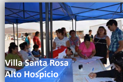
Villa Santa Rosa Alto Hospicio

Vista Hermosa. Inicio marzo 2016. Población: 2mil 740 Habitantes; 548 viviendas