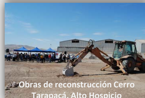
Obras de reconstrucción Cerro Tarapacá, Alto Hospicio