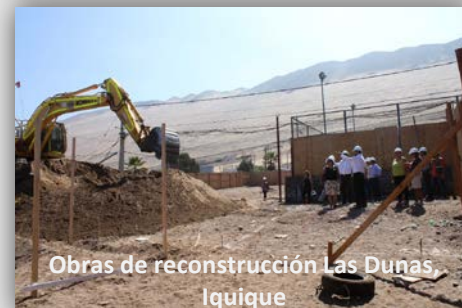
Obras de reconstrucción Las Dunas, Iquique