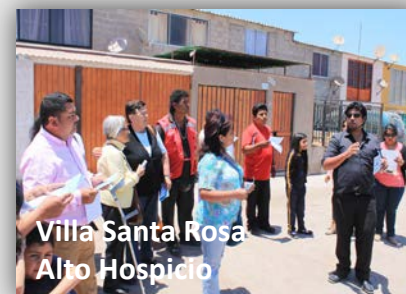
Villa Santa Rosa Alto Hospicio